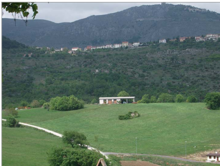
FOTO 6: capannone visibile da piazza D'Annunzio e da altri punti panoramici del centro storico