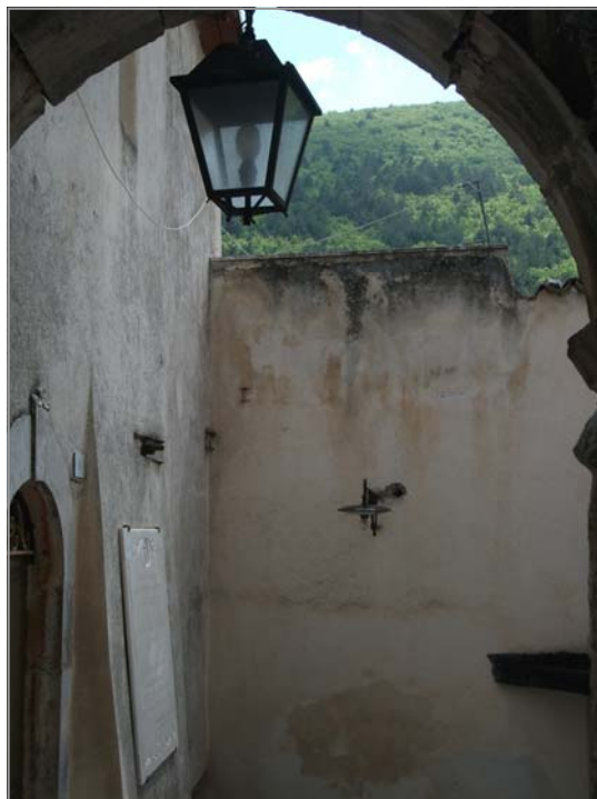
FOTO 11: illuminazione pubblica non coordinata in un vicolo di via Battisti