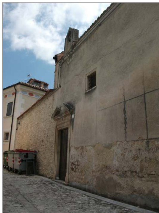
FOTO 14: cassonetti per il conferimento dei rifiuti presso la chiesa di San Michele