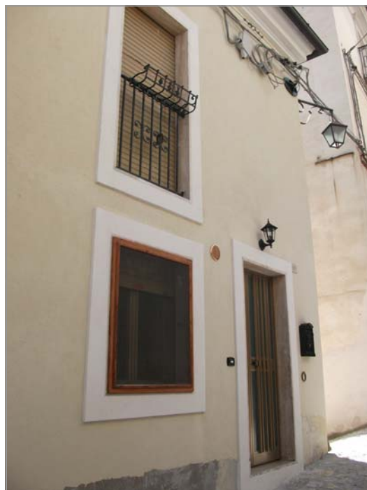
FOTO 9: porta di alluminio e persiane avvolgibili in via Vittorio Veneto n. 15A