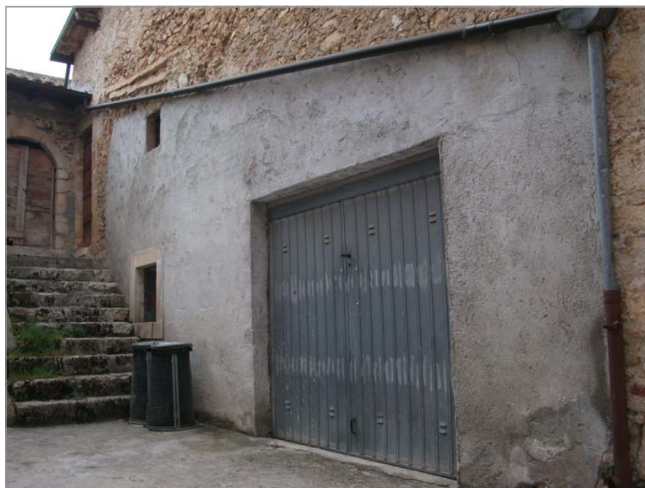
FOTO 8: esempio negativo di ristrutturazione con cemento armato e aperture non integrate nel contesto architettonico in via Roma