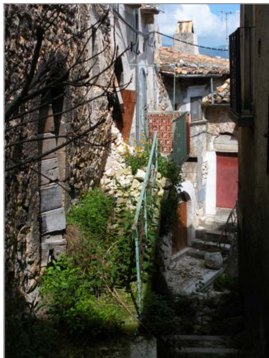
FOTO 5: esempio di strada del centro storico ingombra di piante infestanti e macerie