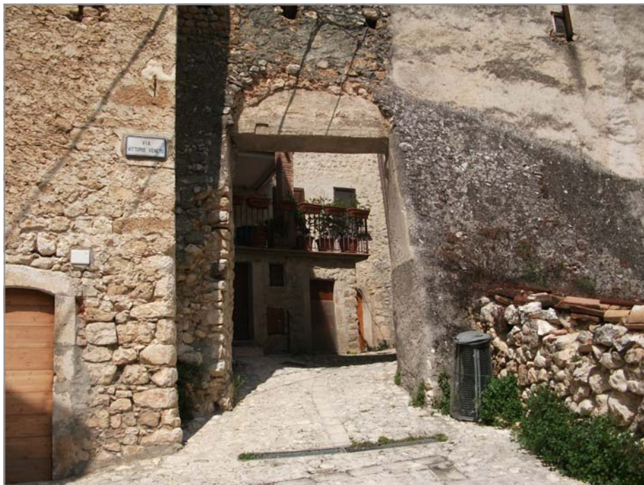
FOTO 7: esempio negativo di ristrutturazione con cemento armato in via Vittorio Veneto