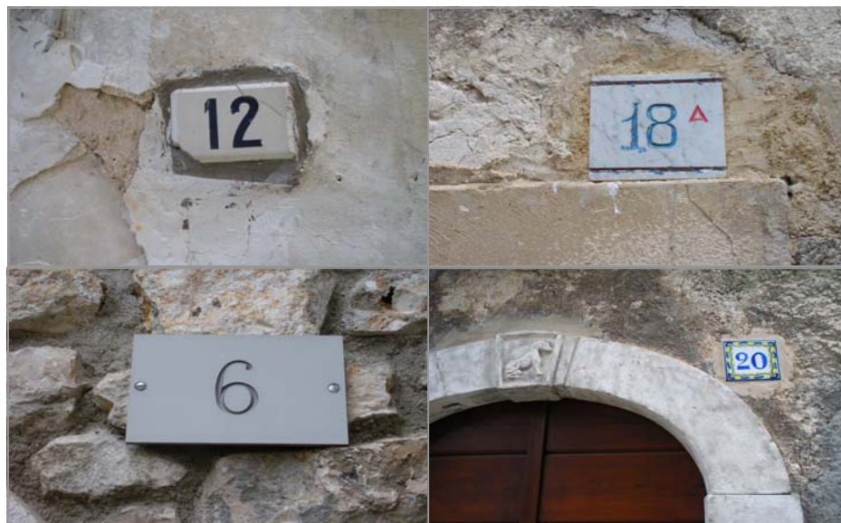
FOTO 13: tipologie diverse di targhe con i numeri civici nel centro storico